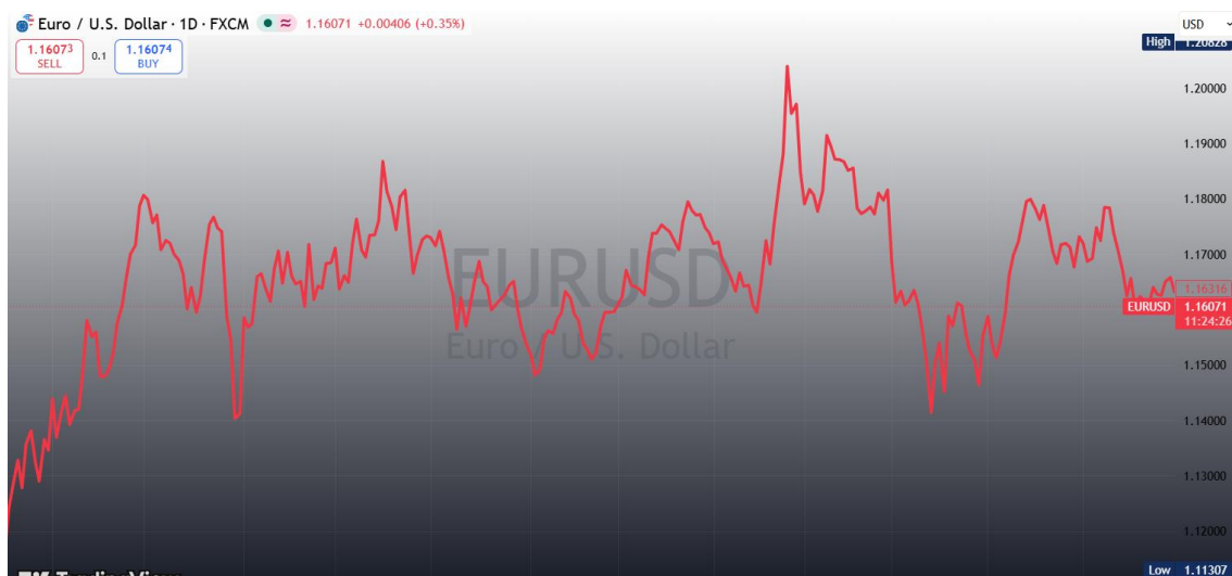
Evolución euro/dólar últimos 12 meses